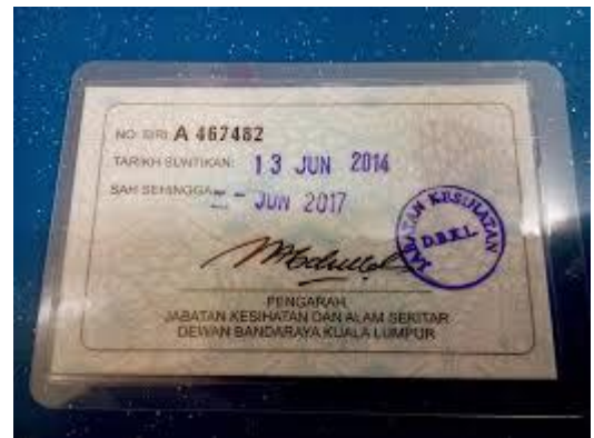
CONTOH SLIP SUNTIKAN TY2