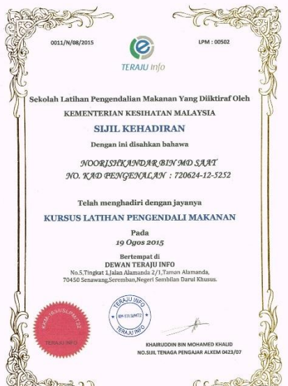
CONTOH SIJIL KURSUS PENGENDALIAN MAKANAN