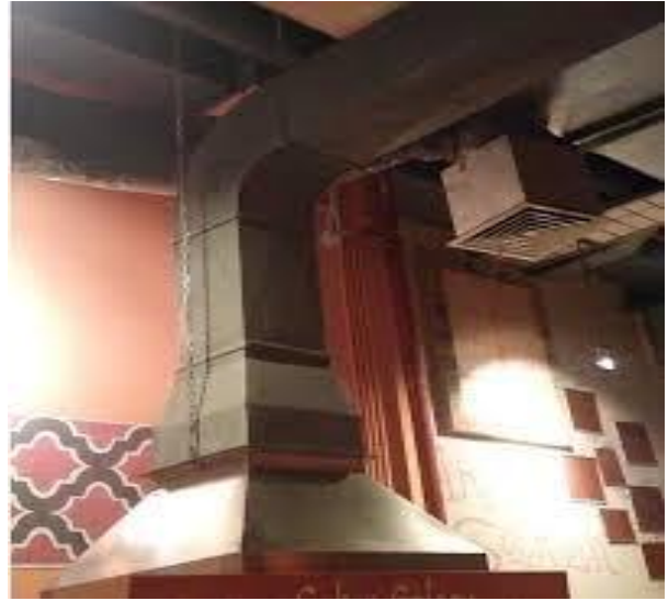
CONTOH CEROBONG ASAP