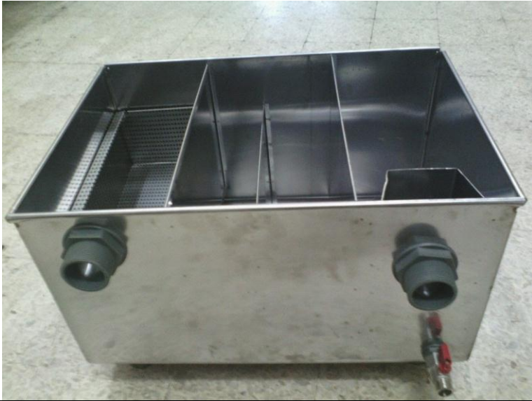
CONTOH GAMBAR GRIS TRAP (PERANGKAP MINYAK)